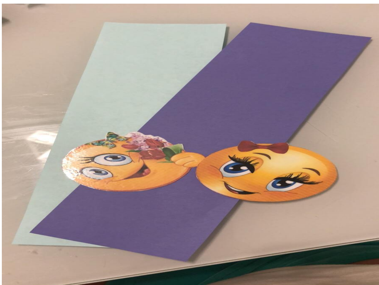
Материал для изготовления волшебного конвертика.