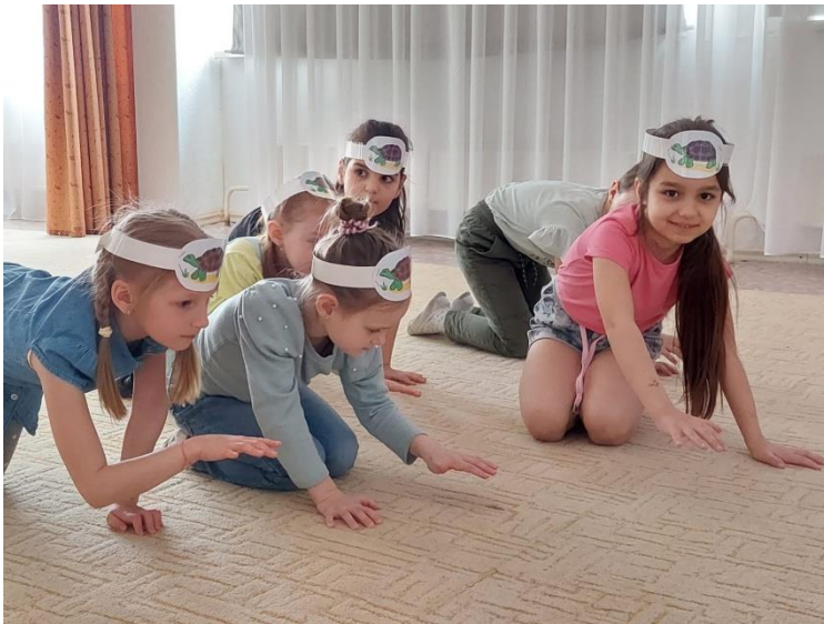
Дидактическая игра «Музыкальные контрасты» (Черепахи)