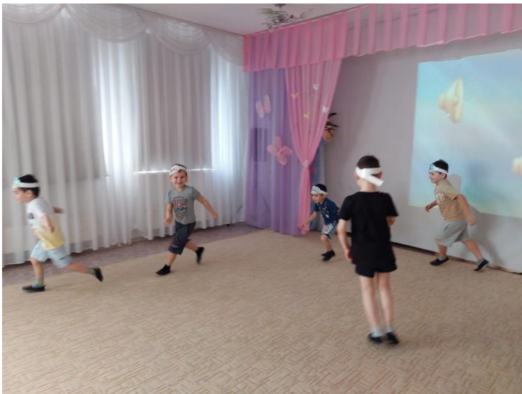
Дидактическая игра «Музыкальные контрасты» (Антилопы)

В необычном зоопарке есть голубое озеро и живёт на этом озере изумительной красоты Лебедь. Детям предложили прослушать музыкальное произведение и представить о чём рассказывает музыка. С помощью оздоровительного самомассажа ребята превратились в прекрасных белых Лебедей.